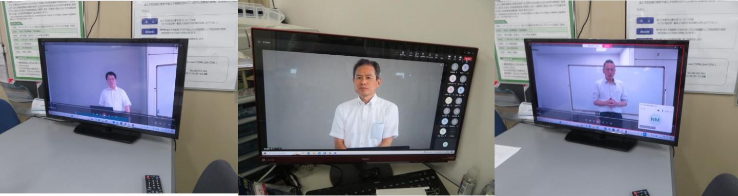
第6日目のWeb講座風景