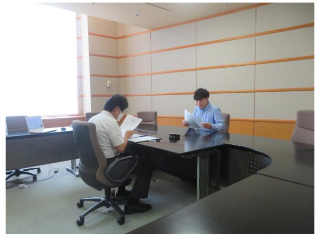
鳥取の試験・面接風景