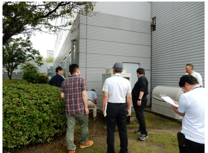
ビル現地診断の風景