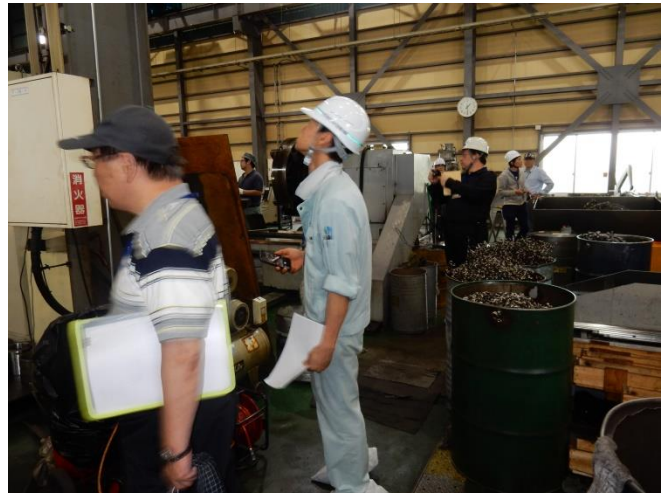
工場現地診断の風景