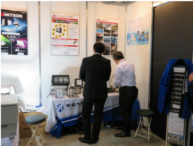
末松九機株式会社