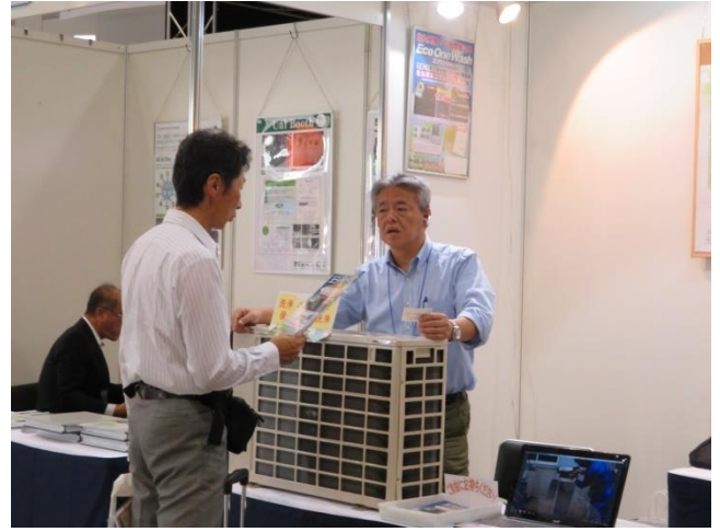
株式会社エコプラスワン