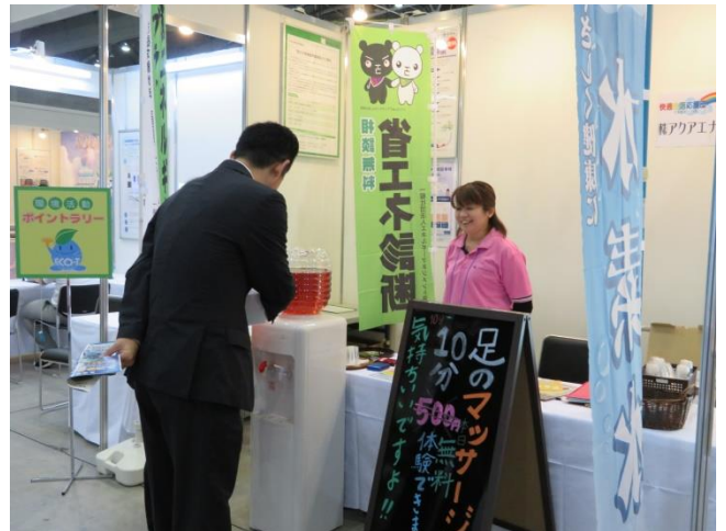
株式会社ウエルビー