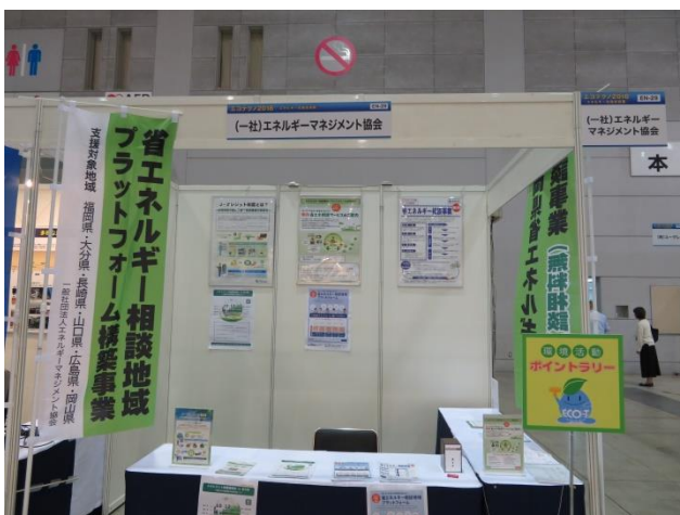
一般社団法人エネルギー・マネジメント協会